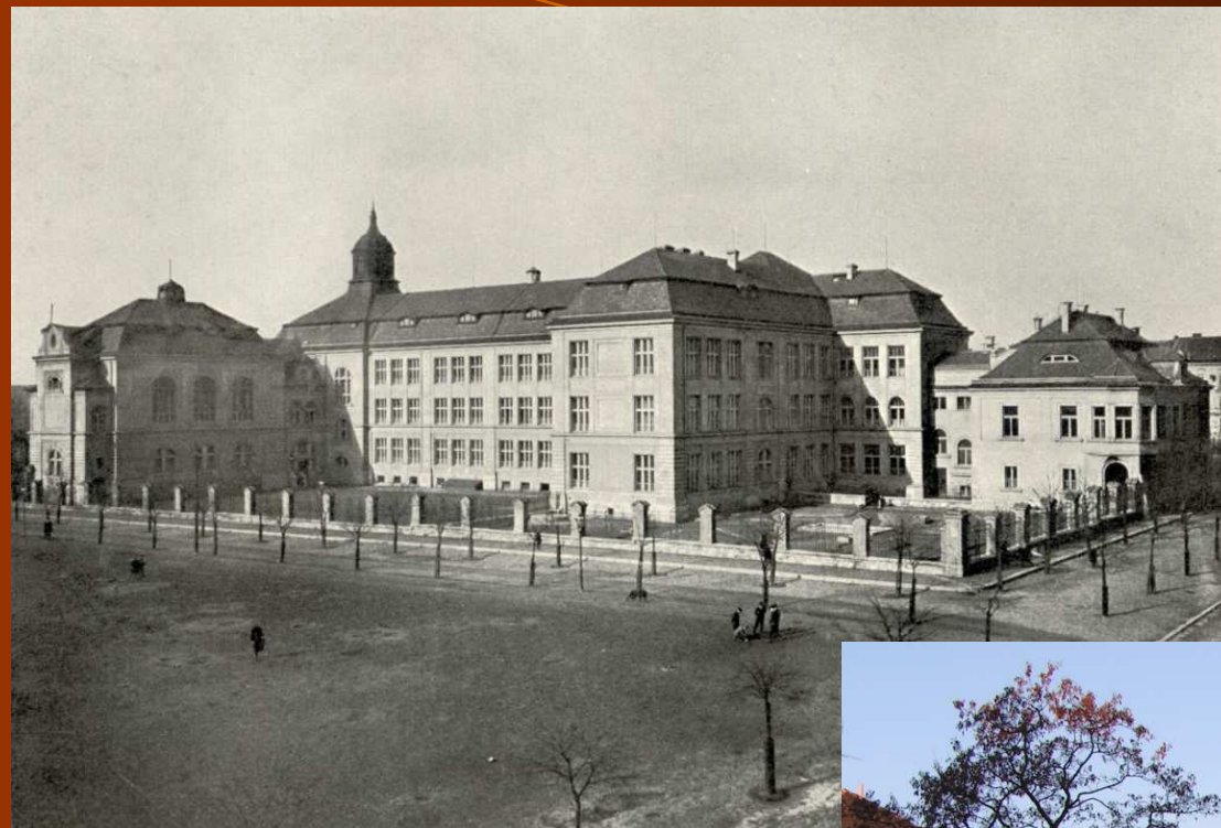
Gymnázium, Plzeň Mikulášské nám. 23